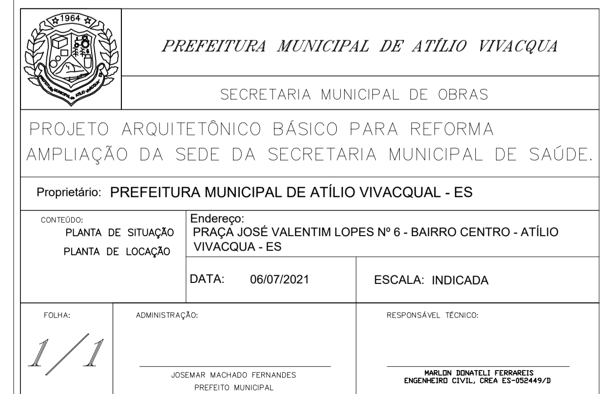
PLANTA DE LOCAÇÃO DA EDIFICAÇÃO