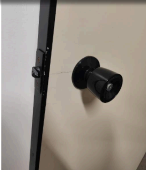
Figura 7 PROCURADORIA MUNICIPAL