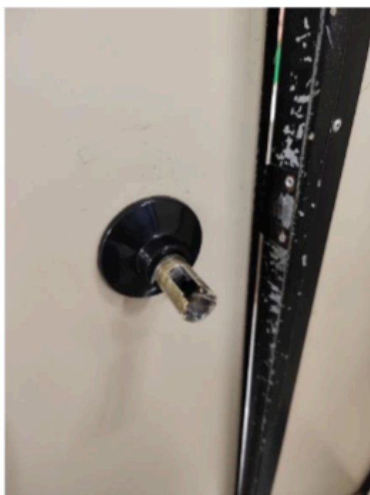
Figura 4-3 ASSESSORIA DE GABINETE