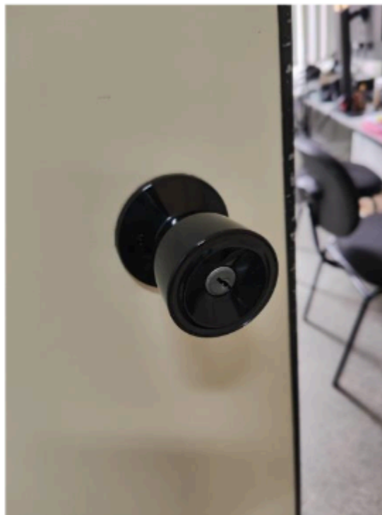
Figura 1-2 OUVIDORIA