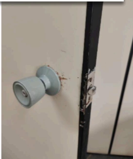
Figura 2 PROCURADORIA GERAL