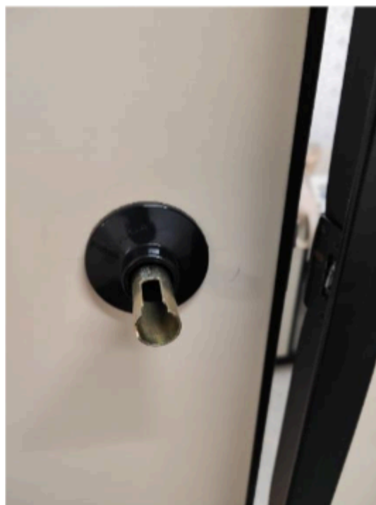
Figura 3-4 NUCLEO DE COMUNICAÇÃO