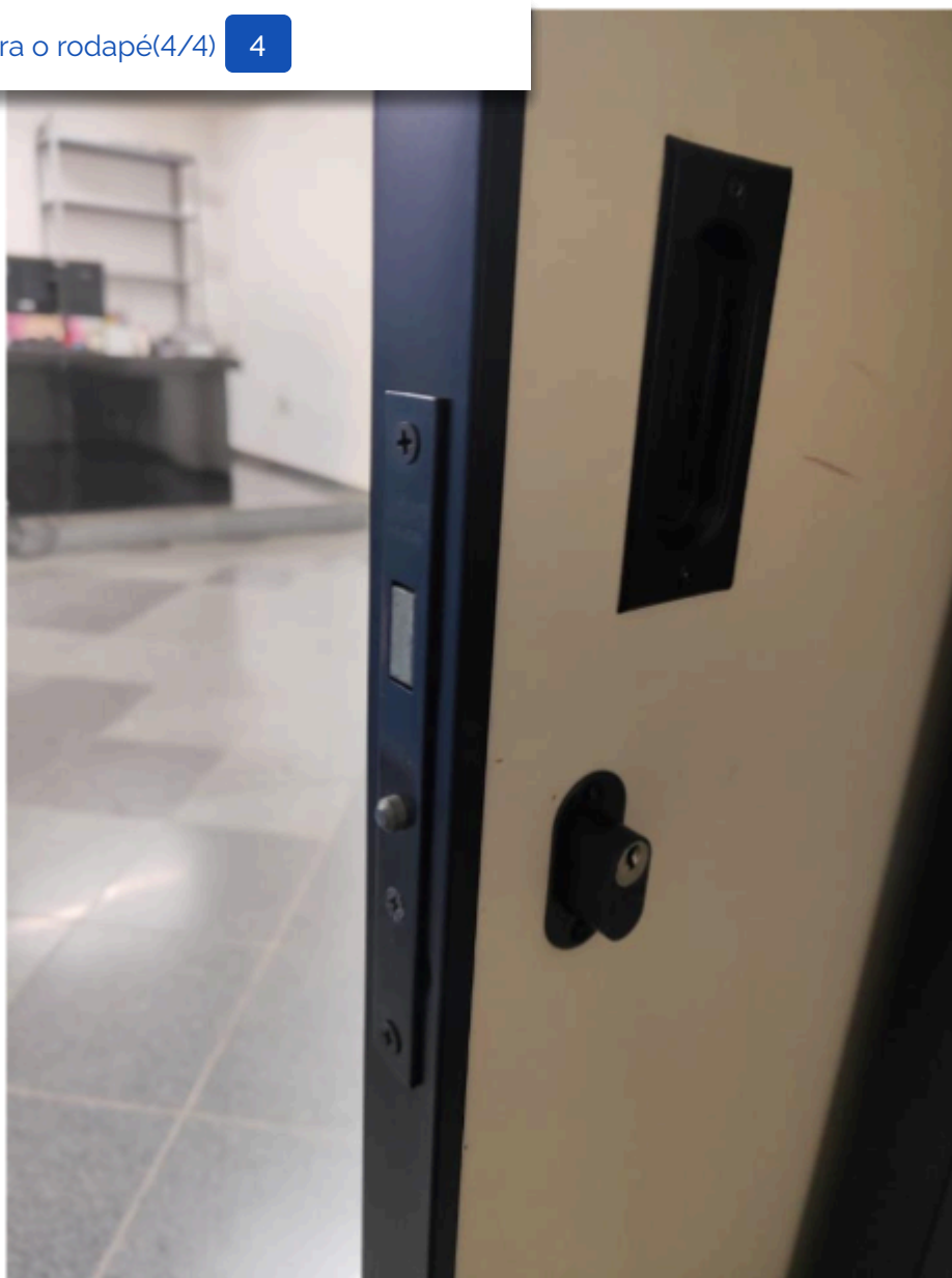
Figura 8 SETOR DE DISTRIBUIÇÃO