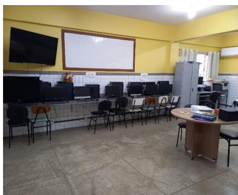
SALA DE CONVIVÊNCIA