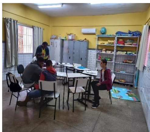
SALA DE AEE 02