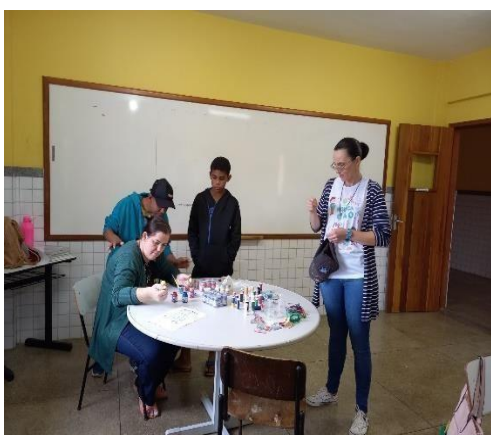
SALA DE AEE 01