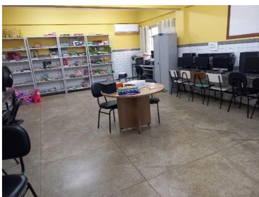
SALA DE CONVIVÊNCIA