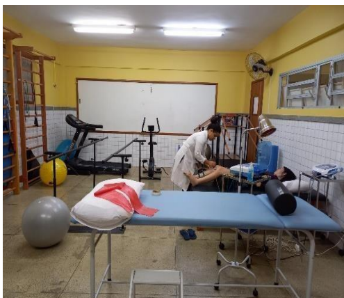
SALA DE REABILITAÇÃO

Associação Pestalozzi de Atilio Vivacqua Centro de Atendimento Educacional Especializado "Aldacyr da Silva Candido Leal". Rua Projetada – s/nº - Bairro: Alto Niterói – Atilio Vivacqua – CEP: 29.490-000 - Tel/fax: 3538-1510 CNPJ: 36.403.574/0001-58 / E-mail: pestalozziav2004@gmail.com