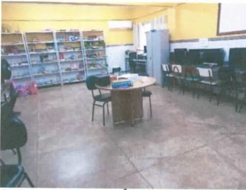
SALA DE CONVIVÊNCIA