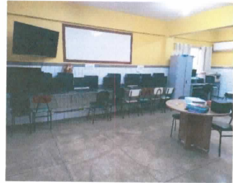
SALA DE CONVIVÊNCIA