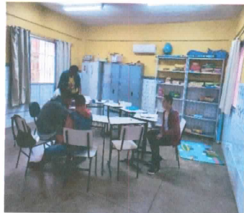
SALA DE AEE 02