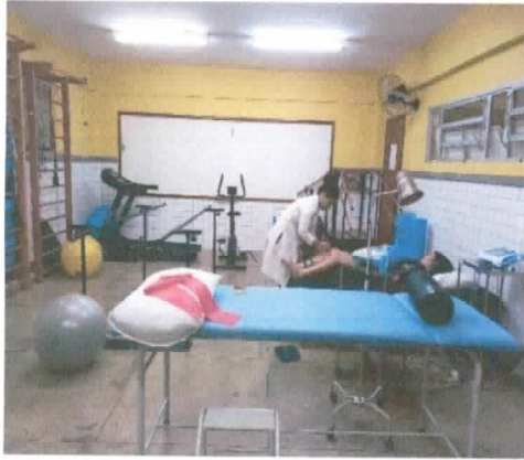
SALA DE REABILITAÇÃO