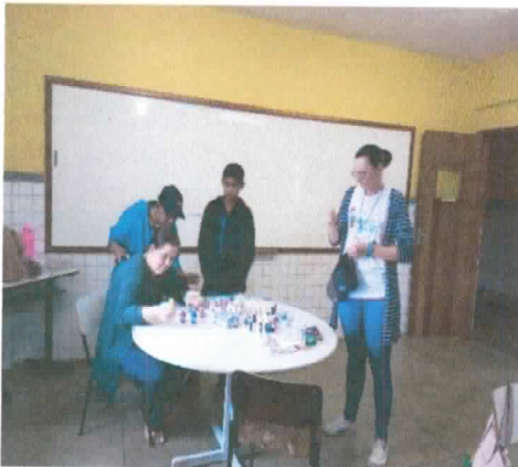
SALA DE AEE 01