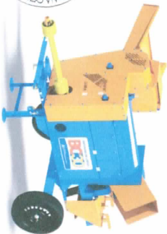
BC-30 COM EIXO