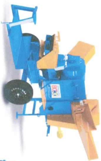
BC-30 COM PLATAFORMA

*Podem ocorrer variações dependendo do tipo de produto, unidade do grão, grau de impurezas e resgagem da máquina. **Para bater arroz, cortar as ramas no comprimento aproximado de 40 cm.