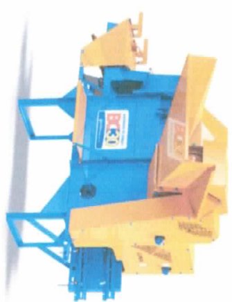
BC-30 COM ACESSÓRIO PARA MOTOR