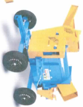
BC-30 TRACÇÃO ANIMAL