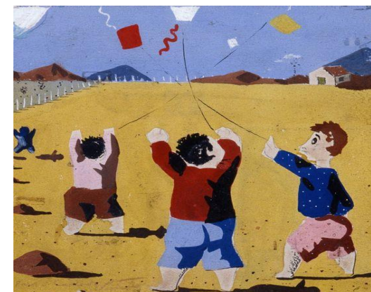
Roda Infantil, 1932, óleo sobre tela