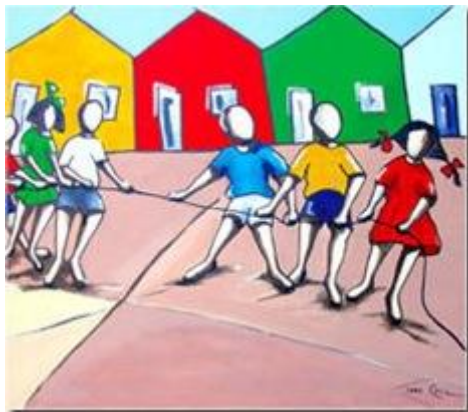
Cabo de guerra