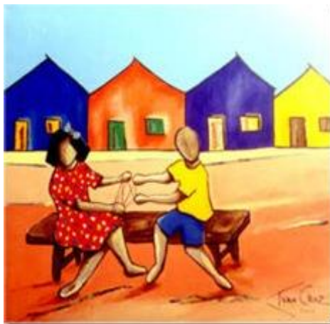
Cama de gato