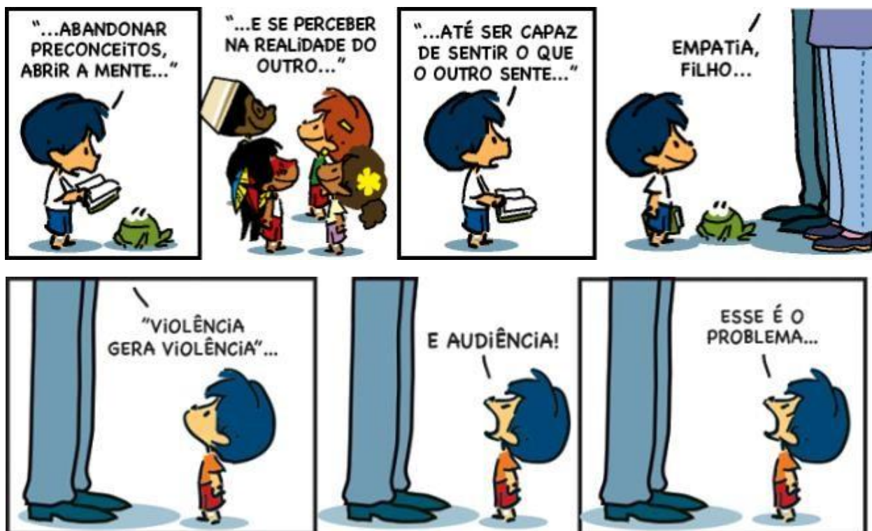
Figura 1 https://tirasarmandinho.tumblr.com/

2- A empatia é a concepção de se pôr no lugar do outro, entender seus medos, sofrimentos e alegrias. Você se sente uma pessoa empática?