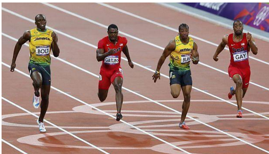
Foto de uma prova de velocidade