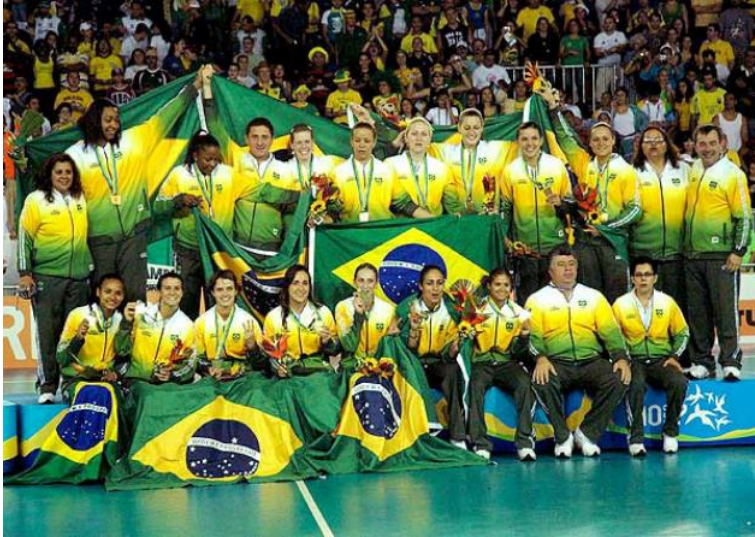
Foto da seleção Brasileira Campeã