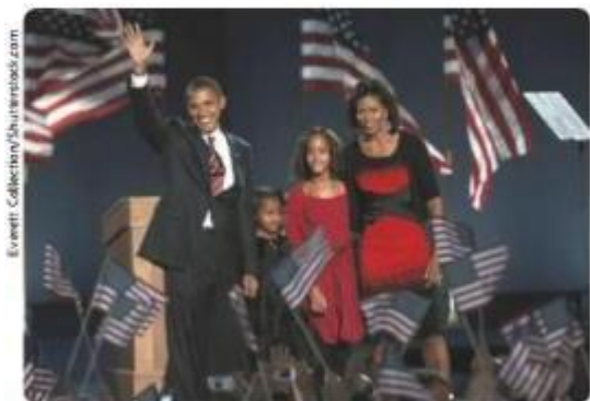
O presidente Barack Obama e sua família comemoram a vitória nas eleições. Chicago, Illinois, Estados Unidos, 2008.

Só em 1964 [...] o presidente Lyndon B. Johnson aprovou a lei de direitos civis que vale até hoje nos EUA. A lei proibia a discriminação em lugares públicos e autorizava o governo dos EUA a processar qualquer estado que promovesse a segregação racial. No ano seguinte, o National Voting Rights Act passou a proibir os estados de impor qualquer restrição racial aos eleitores.