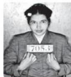
Rosa Parks é presa após o episódio do ônibus de Montgomery, Alabama, 1955.

Luther King aplicou o método da desobediência civil para pedir leis igualitárias nos EUA, e por isso ganhou o Nobel da Paz em 1964. Até 1968, quando foi assassinado, ele discursou mais de 250 vezes pela igualdade, incluindo aí seu famoso discurso, feito em Washington, em 1963: “Tenho um sonho que meus quatro filhos viverão, um dia, em um país onde não sejam julgados pela cor de sua pele, e sim por seu caráter”. [...]