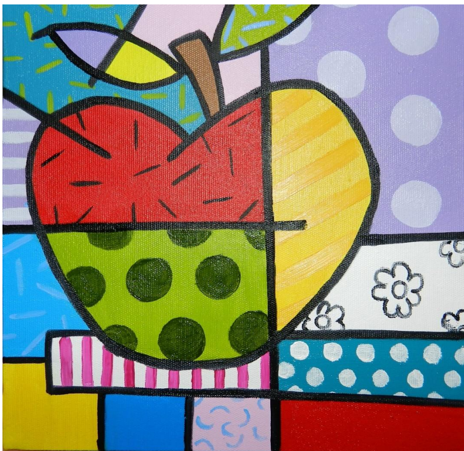
Maça – Obra de Romero Brito

https://br.pinterest.com/emanuelabosch/romero-britto-2/?autologin=true