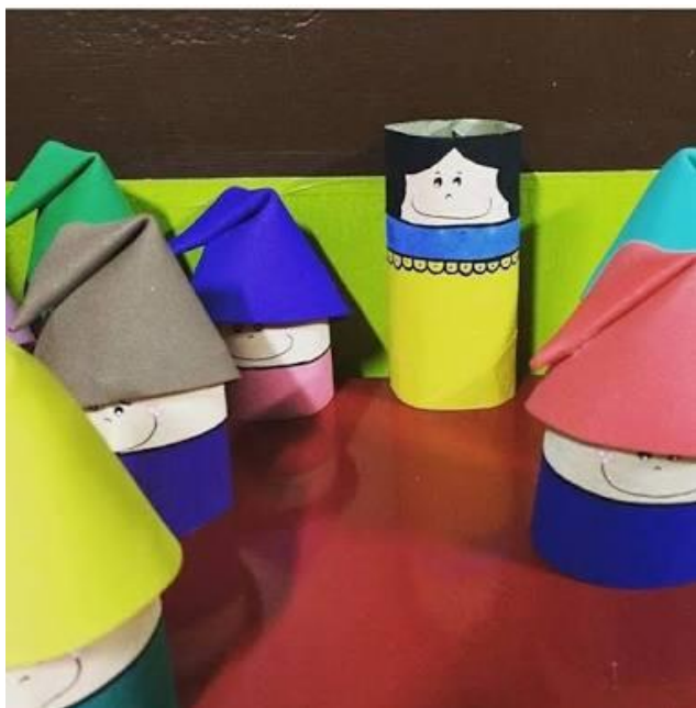
Molde da Branca de Neve