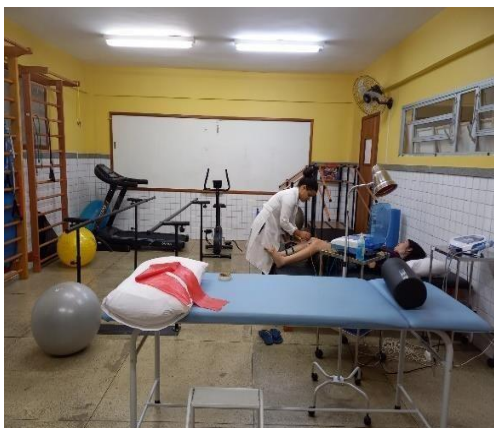
SALA DE REABILITAÇÃO

Associação Pestalozzi de Atilio Vivacqua Centro de Atendimento Educacional Especializado "Aldacyr da Silva Candido Leal". Rua Projetada – s/nº - Bairro: Alto Niterói – Atilio Vivacqua – CEP: 29.490-000 - Tel/fax: 3538-1510 CNPJ: 36.403.574/0001-58 / E-mail: pestalozziav2004@gmail.com